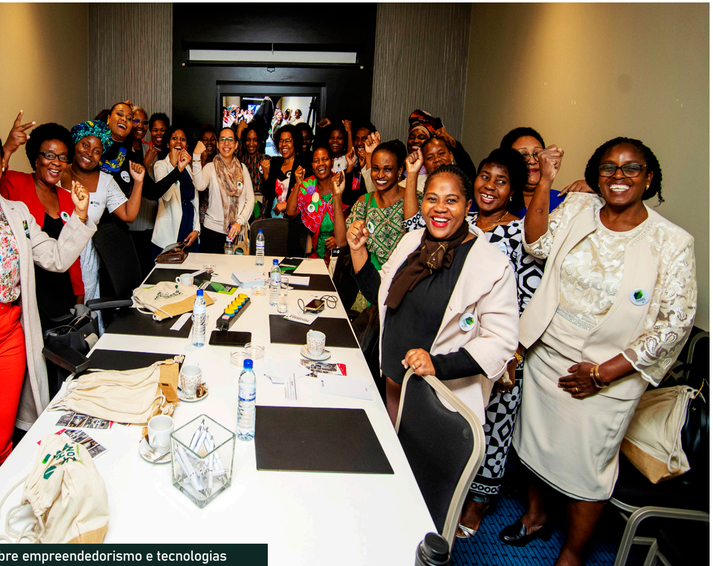
obre empreendedorismo e tecnologias