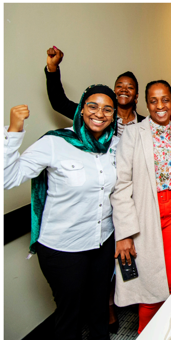
Alegria total após a oficina temática sobre